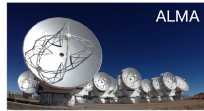
図 3：分子ガスの観測に使われた電波望遠鏡群

これら研究の1つの節目として、ガス雲衝突による星形成についての現状の理解をまとめたレビュー論文を含む、21編の新たな論文が1冊の特集号として2021年1月に刊行されました。この特集号の意義は大きく2つあります。1つ目は、これまでわずか数天体でしか知られていなかった現象が、近年の発見により92個にまで増えたことです。特に、大規模な星団はその多くからガス雲の衝突の痕跡が見つかっています。これにより、大質量星を含む星団は、複数のガスが巡り合い、衝突しなければ誕生できない可能性が高まってきました。宇宙物理学の一つの重要課題である星団誕生のきっかけは、ガス雲の衝突なのかもしれません。2つ目に、ガス雲衝突による星団誕生の痕跡が、私たちの住む天の川銀河内で場所を問わず、さらには他の銀河でも普遍的に発見されつつあることです。星団は宇宙誕生から今日に至るまで、ガス雲の衝突によって起こり続けてきたのかもしれません。