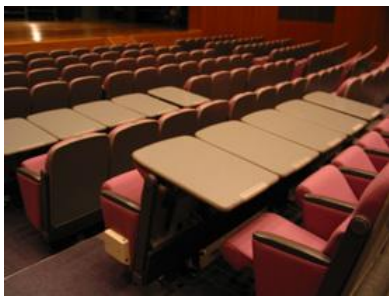
テーブル使用時の客席