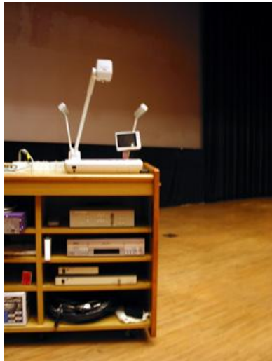
書画カメラとビデオ装置