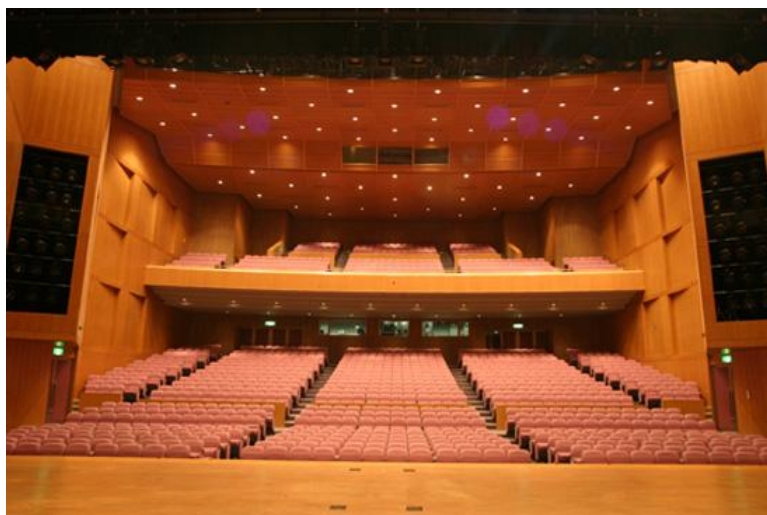
舞台から見た客席