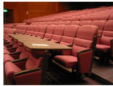
テーブル使用時の客席