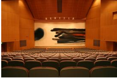
緞帳を下ろした時の舞台（客席より）