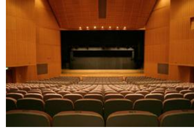
緞帳を上げた時の舞台（客席より）