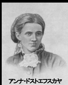
アンナドストエフスカヤ