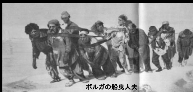
ボルガの船曳人夫