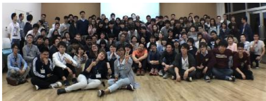
I-wing グローバルコモンズにて