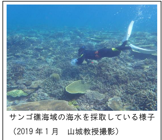
サンゴ礁海域の海水を採取している様子 (2019年1月 山城教授撮影)

サンゴ礁は海洋における生物多様性の要であり、世界の漁業に年間数十億ドルをもたらすとされています[Burke et al. 2011]。しかし、地球温暖化やそれに伴う病原菌の活発化によってサンゴの白化・壊死が引き起こされており、国際的な問題となっています。サンゴ礁を構成する造礁サンゴの多くは2030年までに絶滅するとされており、サンゴ保護は非常に重要な課題です。近年、サンゴに共在する一部の細菌が、環境ストレスや病原菌によって引き起こされるサンゴの白化を抑えることが報告されており、サンゴ共在細菌をプロバイオティクスとして用いることでサンゴを保護できる可能性に注目が集まっています。