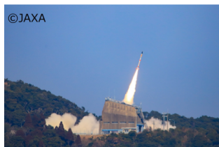
ロケット打上げの瞬間