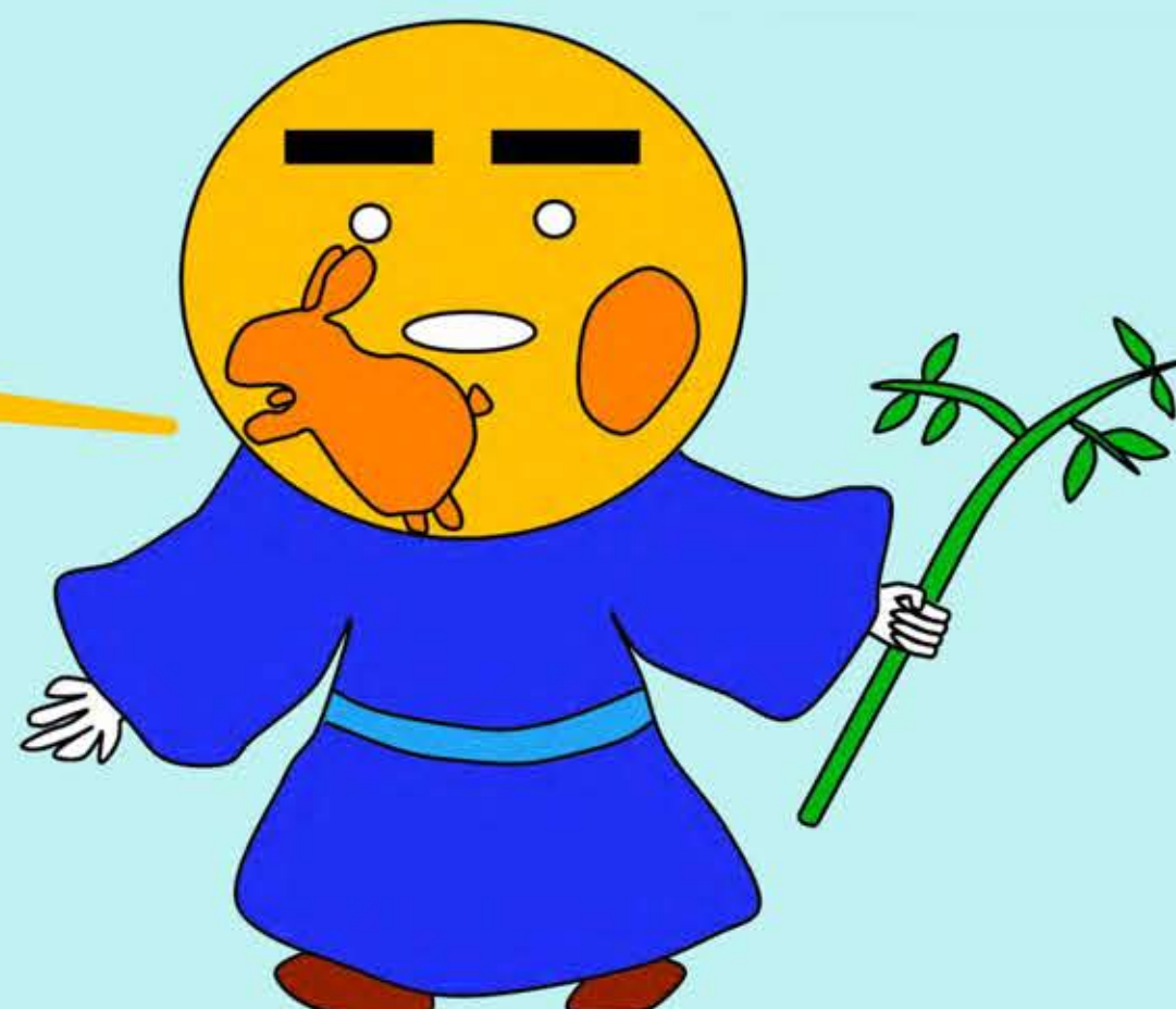
宇宙研キャラクター 七夕かけるくん