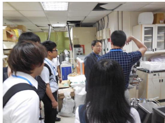
長庚大学でのラボツアー