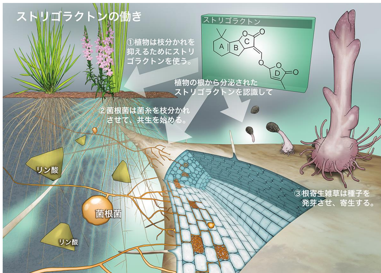
図1 ストリゴラクトンのはたらき

①植物体内でつくられたストリゴラクトンは自身の枝分かれ（脇芽の成長）を抑えるのに使われます。また、②土壌から吸収した栄養（主にリン酸）を植物に分け与えてくれる生物である菌根菌は、植物の根から分泌されたストリゴラクトンを認識して菌糸を枝分かれさせて、共生を始めます。一方で、③根寄生雑草（ストライガやオロバンキなど）は、ストリゴラクトンを認識して種子を発芽させ、根に寄生して栄養を奪います。