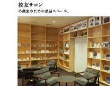
校友サロン 卒業生のための読書スペース。