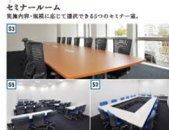
セミナールーム 範囲内容・人数に応じて選択できる5つのセミナー室。