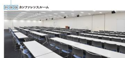
カンファレンスルーム