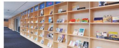
2Fライブラリー 本学の教員や卒業生、ライブラリーにまつわる方々を歓迎。