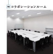
コラボレーションルーム