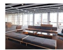
コモンス 共用スペース、持ち合せや懇談等に利用できます。

卒業生のための“くつろぎと語らいの空間” 同窓会の会合に、懐かしい友人との語らいにご利用いただけるサロンは、新たな出会いや交流が生まれる場所でもあります。