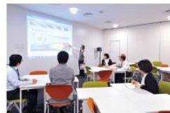
A1 A2 アクティブラーニングルーム 目的に応じて座席をアレンジ可能。