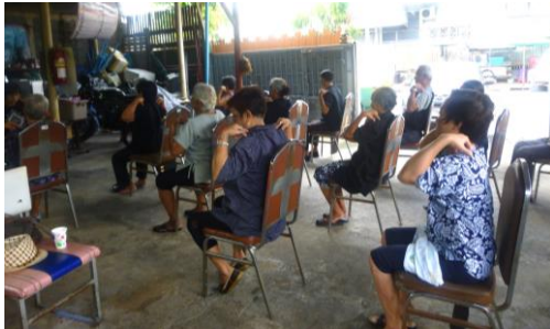
(Elderly Club の見学時)

タイでは、国をあげてコミュニティヘルスプロモーションの活動が積極的に行われています。いかにその地域の住民が参加し主体的に健康活動（エクササイズ、セミナーなど）を行っていくかに看護師も尽力しており、看護師はあくまで下支えで住民に寄り添いながら、地域のエンパワーメントを促していく存在となっていることが印象的でした。そして、同時に訪問看護活動も行いながら、その地域全体の健康管理を担っていました。