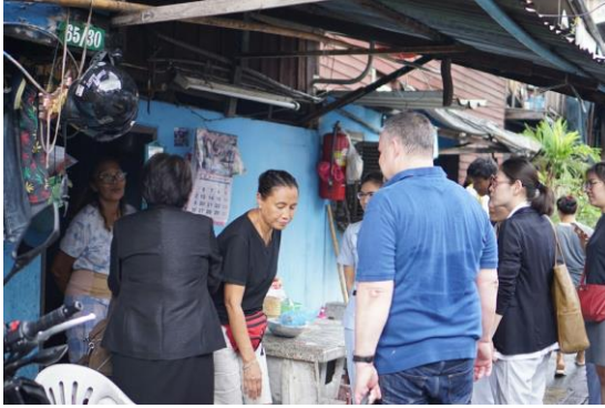
(ある家庭を訪問した時の写真)

タイの家族は、3世代など大家族で暮らしている世帯もまだまだ多く、育児や介護といった身体的なケアも家族の中で分担して行われるのが一般的だということ、その根底には、両親の看護・介護を行うのは子どもの責任であるという考え方があり、もし同居していなくても、子どもたちがシフトを組んで協力して両親の面倒をみる習慣があることが知りました。また、男役割、女役割といった家庭でのジェンダー意識は強くなく、“お嫁に行く”という感覚も持っていないことも分かりました。