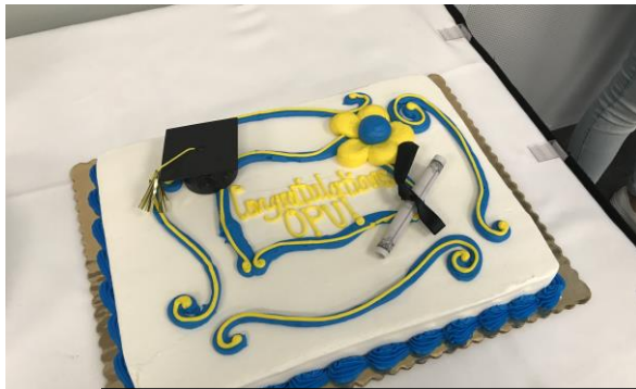
Graduation Ceremony でいただいたケーキ

Study Abroad Report from the OPU students