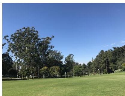
UCI の中央にある公園