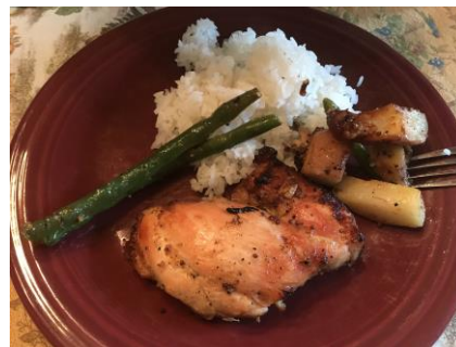
ホストマザーの手料理