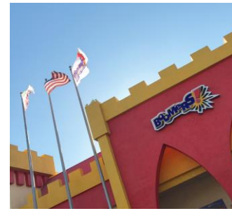
ボーリングセンター