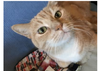
ホストファミリーの猫