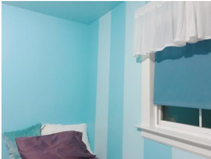
用意してもらった部屋

私のホストファミリーの家族構成は、父、母、祖母、3人姉妹（1人は大学近くに住んでいるため不在）、猫2匹、カメ1匹でした。温かいホストファミリーが私を受け入れてくれて、とてもいい3週間を過ごせました。とてもきれいな部屋を用意してもらい、美味しい晩御飯をほぼ毎日つくってくれました。夕食後や寝る前にホストファミリーと喋ったり一緒にテレビを見たりして、アメリカについて教えてもらったり、アメリカと日本を比較したりして楽しかったし、一緒に過ごす時間のおかげで英語力も身に付きました。また、休日は教会に連れて行ってもらい、日本では経験できないキリスト教の文化を経験することができました。すごく居心地も良く、ホストファミリーの方々には私にすごく優しくしてくれて、「いつでも帰っておいで」「私たちのことを忘れないでね」「あなたと一緒に過ごすことができよかったです」など、すごく温かい言葉をかけてもらい、お別れの最終日には涙をこらえることができませんでした。