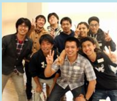
歓迎交流会（府大の学生とともに）