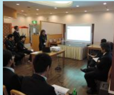
修了式にてプレゼンテーション