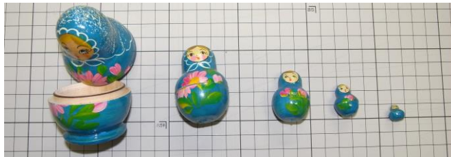
図：身近なフラクタル構造であるロシアの民芸品、マトリョーシカ。

自分の図形の中に自分自身と相似（自己相似）な図形を内包している構造をフラクタルといいます。ロシアの民芸品であるマトリョーシカのような構造のことで、人形の中を開けるとまた人形が、その中にまた人形が入っています。このフラクタルを特徴づけるために、フラクタル次元 D_f (fractal Dimension) を用います。フラクタルを有する図形の大きさ ( y ) の分布は距離 ( x ) に対して「ベキ乗則： y = ax^{-D_f} 」で表され、両対数プロットの傾きから D_f を求めることができます。