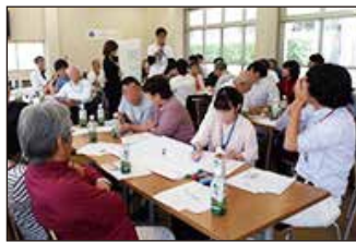
▲府大近所サミット