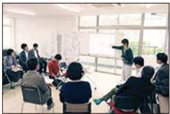
▲堺 × 大学 × 社会貢献セミナー