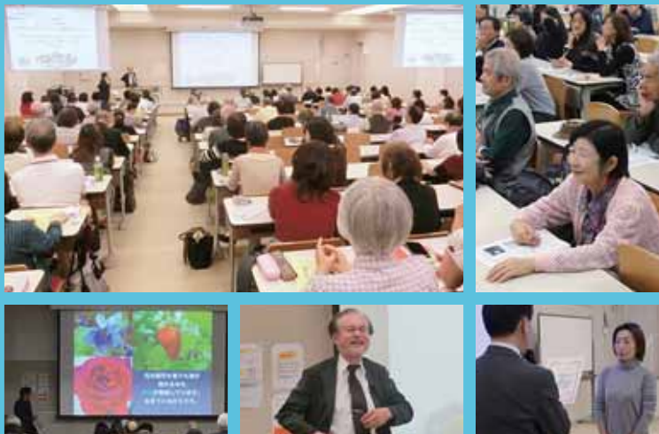
*写真は去年のセミナーの様子です。

いま、私たちがくらす社会は、いろんな課題に直面しています。食の安全や環境、防災や消費者問題など、消費者を取り巻く環境は毎年変化しています。